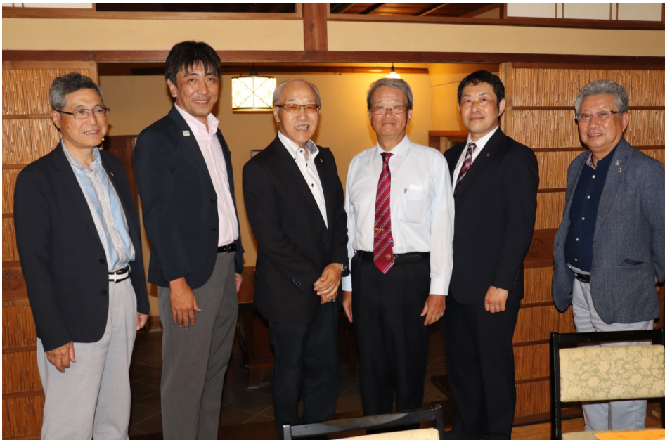
現・次期三役 今年は握手なしで、記念写真にしました。