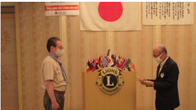
ボーイスカウト名古屋西部地区へ助成金贈呈

全員マスクを着けての例会で、異様な雰囲気でしたが、久しぶりの例会で出席率もよく、楽しい例会となりました。