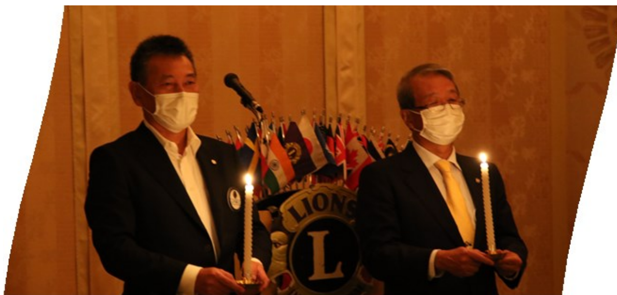
“ 新会員入会式 ”