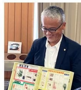
標本はいつも興味をもってくれます。