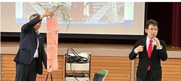
流石の森ライオン 話も尺もバッチリです。