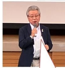
「君たちの夢を守る ために来ました。」