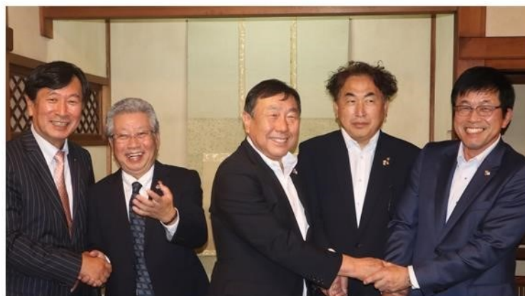
次期会長いつやるの？「今でしょ！」