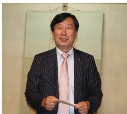
最後の会長挨拶 嬉しいような寂しいような...