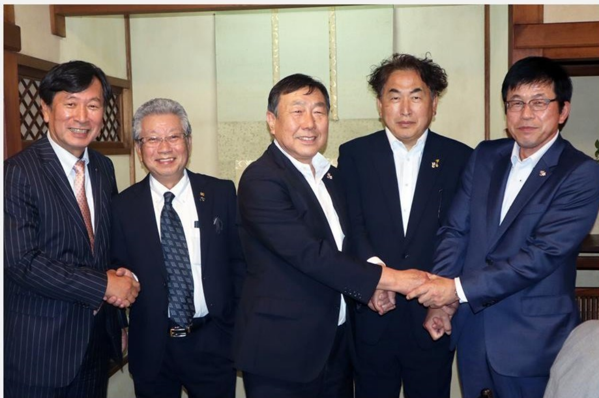
「現・次期役員引継ぎ会」 現・次期 三役握手