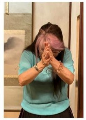
ドネーションの報告 何やら嬉しそう