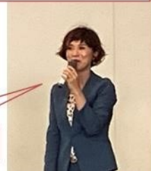
お菓子で世界平和を！

2023年7月7日(金)13:00～13:55 名古屋市立日比野中学校 1年生220名 参加ライオン 12名