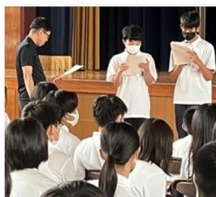
本日も寸劇は大盛り上がり