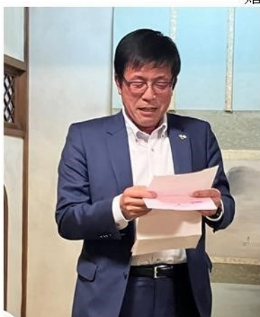
相変わらず流れるような 司会ぶり