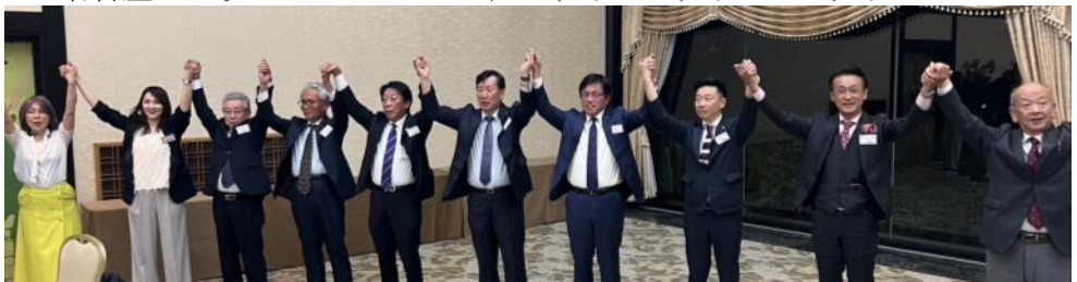
輪になって、また会う日までを歌いました♪初体験の人もいたかも?!