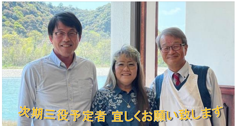
次期三役予定者 宜しくお願い致します