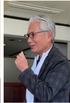
深貝委員長 ありがとうございました。