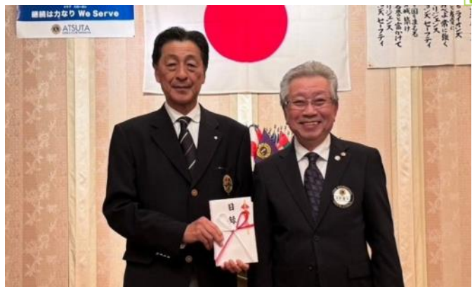
日本ボーイスカウト愛知名古屋西部地区へ助成金10万円贈呈