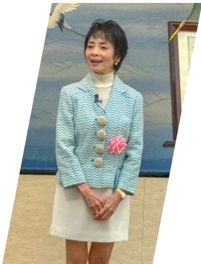
女優・歌手 由美かおる様 記念健康講座