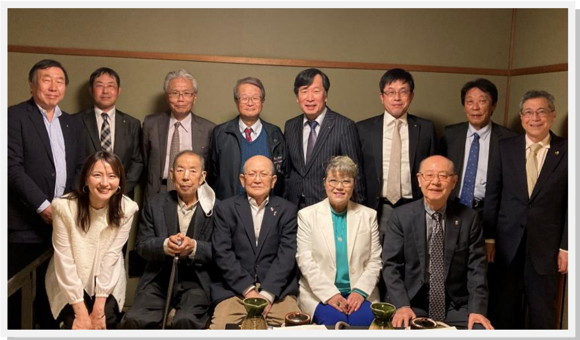
2024年4月12日 次期幹事激励会 本格肉料理 丸小にて