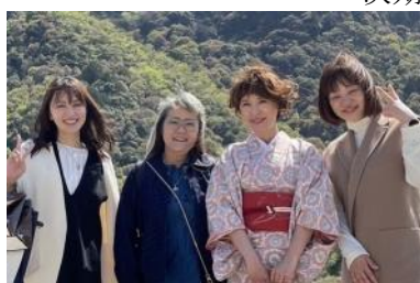
熱田が誇る美女軍団