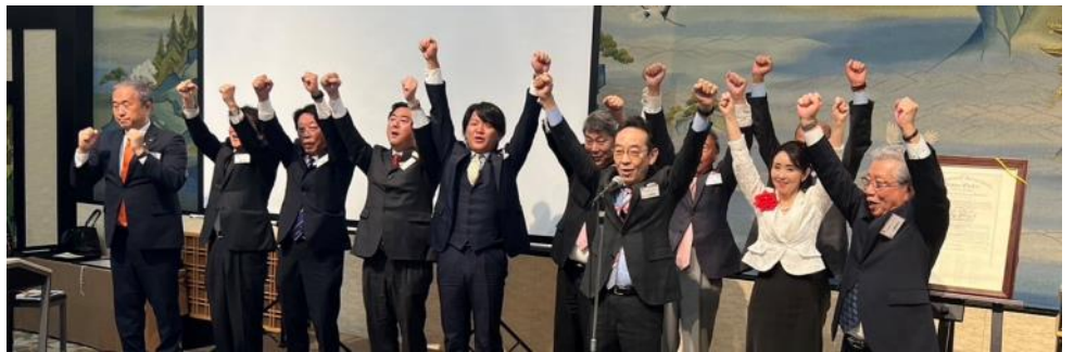
名古屋では珍しい?! ローア三声 ウォー! ウォー!! ウォー!!!