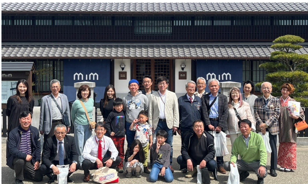
第1442回例会「春の家族例会」 2025年4月2日(水) ミツカンミュージアム前にて