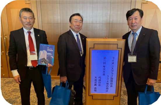
次期三役で行って来ました