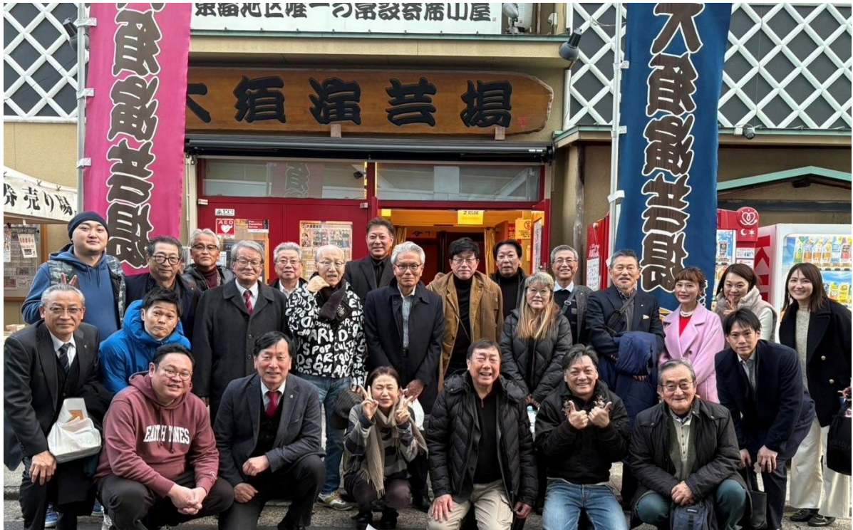
第1462回例会 2026年2月4日(水)持ち出し例会 大須演芸場