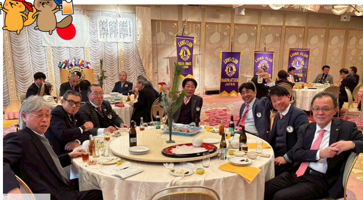
CN60周年で揃えたネクタイで出席しました