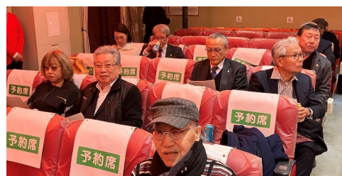
お酒におつまみ準備万端です